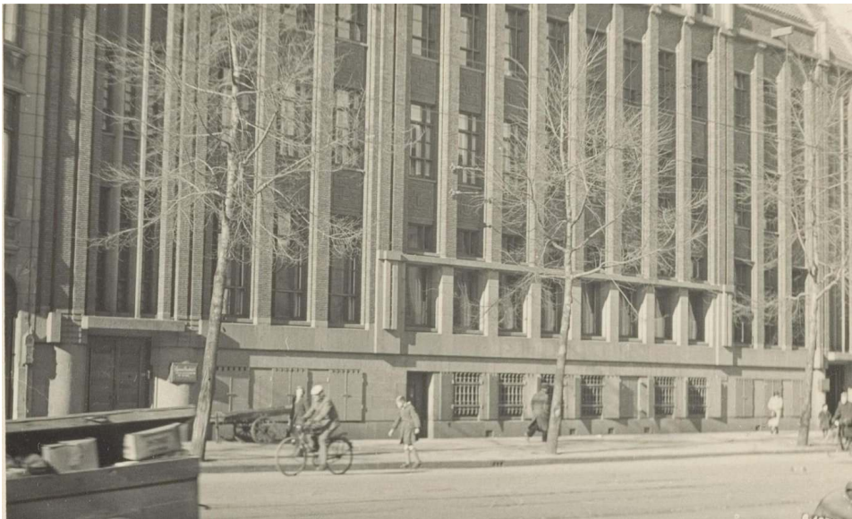
Exterieur van het gebouw van de bank Lippmann Rosenthal & Co, maart 194