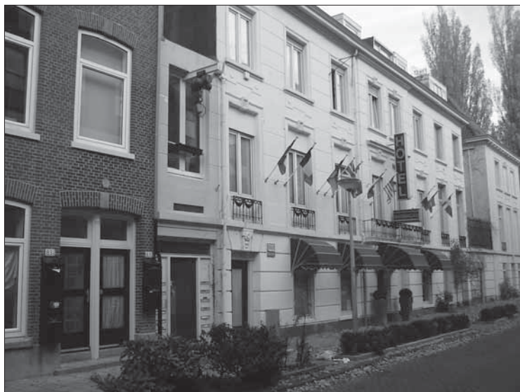
Plantage Muidergracht 87, Amsterdam

niet in het tehuis aanwezig was en zodoende uitstel van executie kreeg.