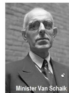
Minister Van Schaik